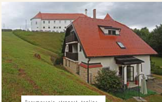
Razumevanje, strpnost, toplina, sočutje – osnovne vrednote, h katerim stremijo v SVZ Hrastovec