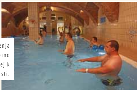
Bistvo življenja je, da gremo skupaj naprej k lepši prihodnosti.